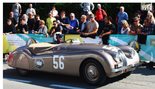
Jaguar XK 120 Alu (1949) – Siegerfahrzeug von 1955 wieder am Start.

Der Verein Freunde des Bergrennens Steckborn feiert dieses Jahr sein 20-Jahr-Jubiläum. Eine Sonderausstellung im Museum Turmhof in Steckborn widmet sich diesem freudigen Ereignis. Die Ausstellung dauert vom 30. Mai bis 18. Oktober 2026 und ist zu den üblichen Öffnungszeiten allen interessierten Besuchern zugänglich. Ein Besuch lohnt sich: Man erfährt viel über die Geschichte seit 1955 bis heute, und sogar Kurzfilme der verschiedenen Bergrennen können bestaunt werden – die Atmosphäre ist dabei fast hautnah erlebbar. Ein Wettbewerb im Museum lässt zudem das Herz von Ratefüchsen höherschlagen, denn attraktive Preise warten auf die ausgelosten Gewinner.