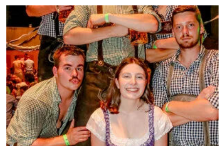
Stimmung in Lederhose und Dirndl