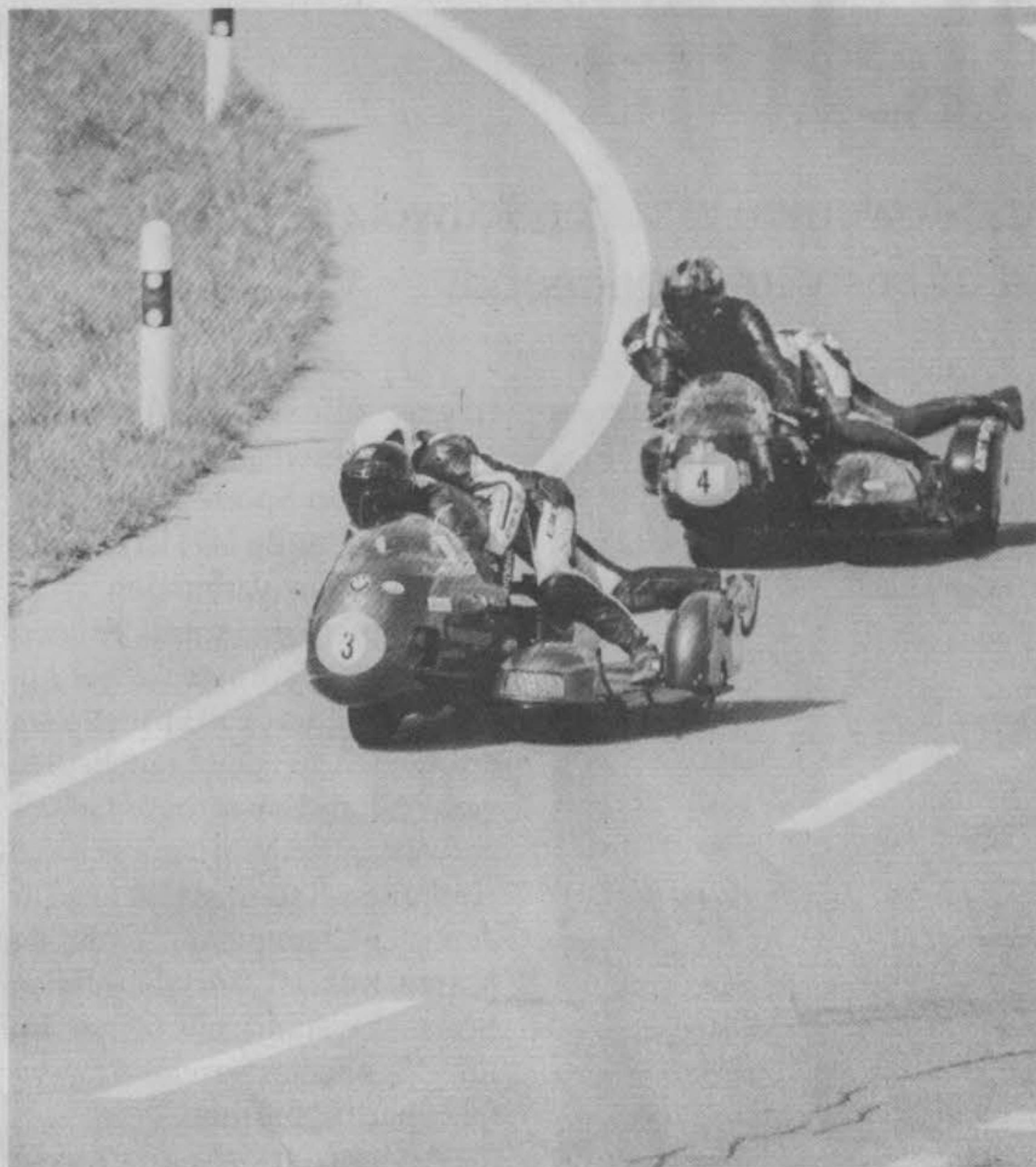
Zwei Seitenwagengefährte in der Kurve liegend.